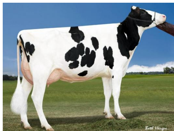
Miss Ocd Robst Delicious