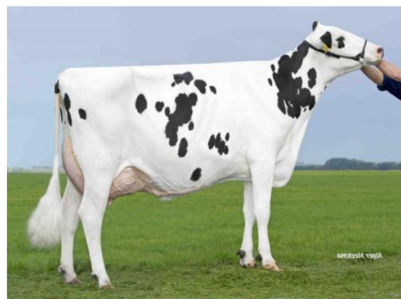
Delta Jiske - matka